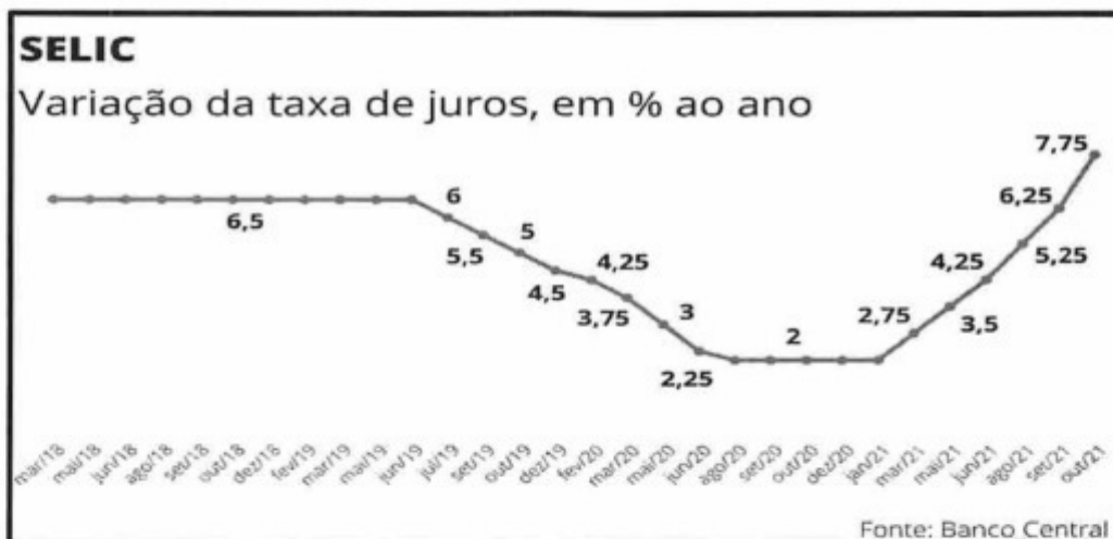
GRÁFICO 01 – TAXA SELIC META