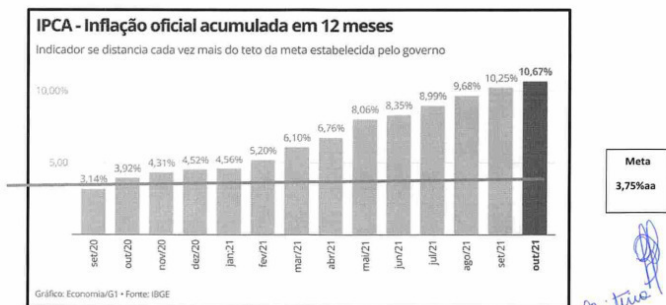
GRÁFICO 02 – IPCA ACUMULADO em 12 MESES x META de INFLAÇÃO